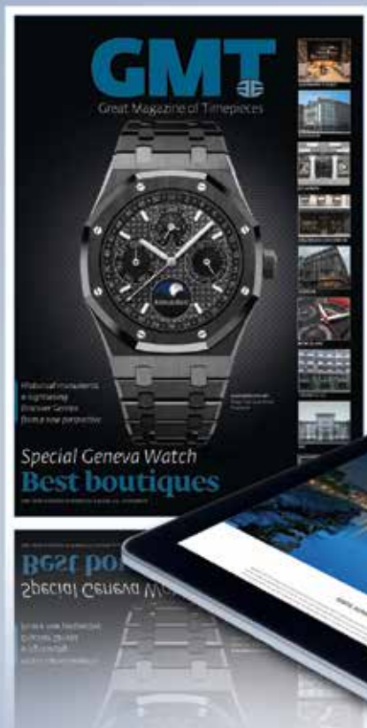
Supplément dans le GMT estival